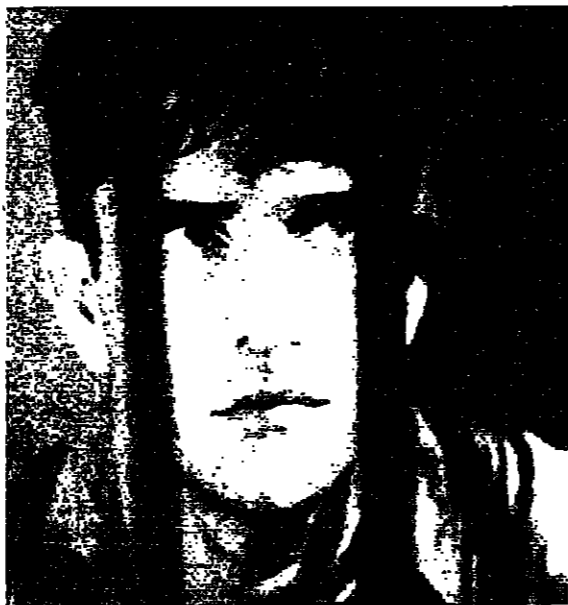
اللق الباحث عن امرأة وراء قضبان السجن - الكبير